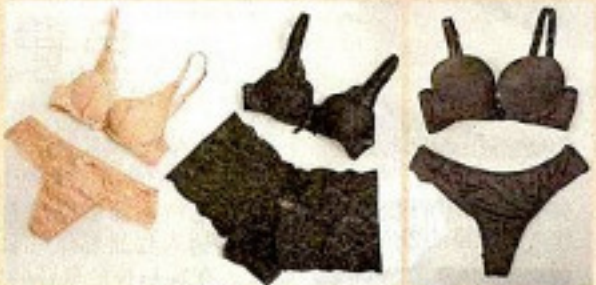
■ Emily參考身邊好友需要和喜好而設計內衣，故其內衣系列以女性友人名稱命名，備28至38A、28至36B及28至34C罩杯尺碼，款式多樣。(Bra/$470至$520、Bottom/各$240)